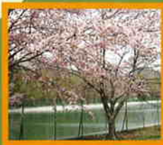
王子製紙千歳第一発電所 (イメージ)