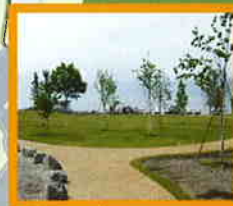
モラップ園地 (イメージ)