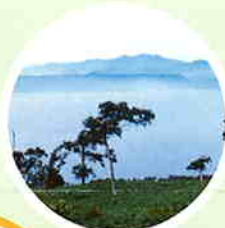
紋別岳からの眺望