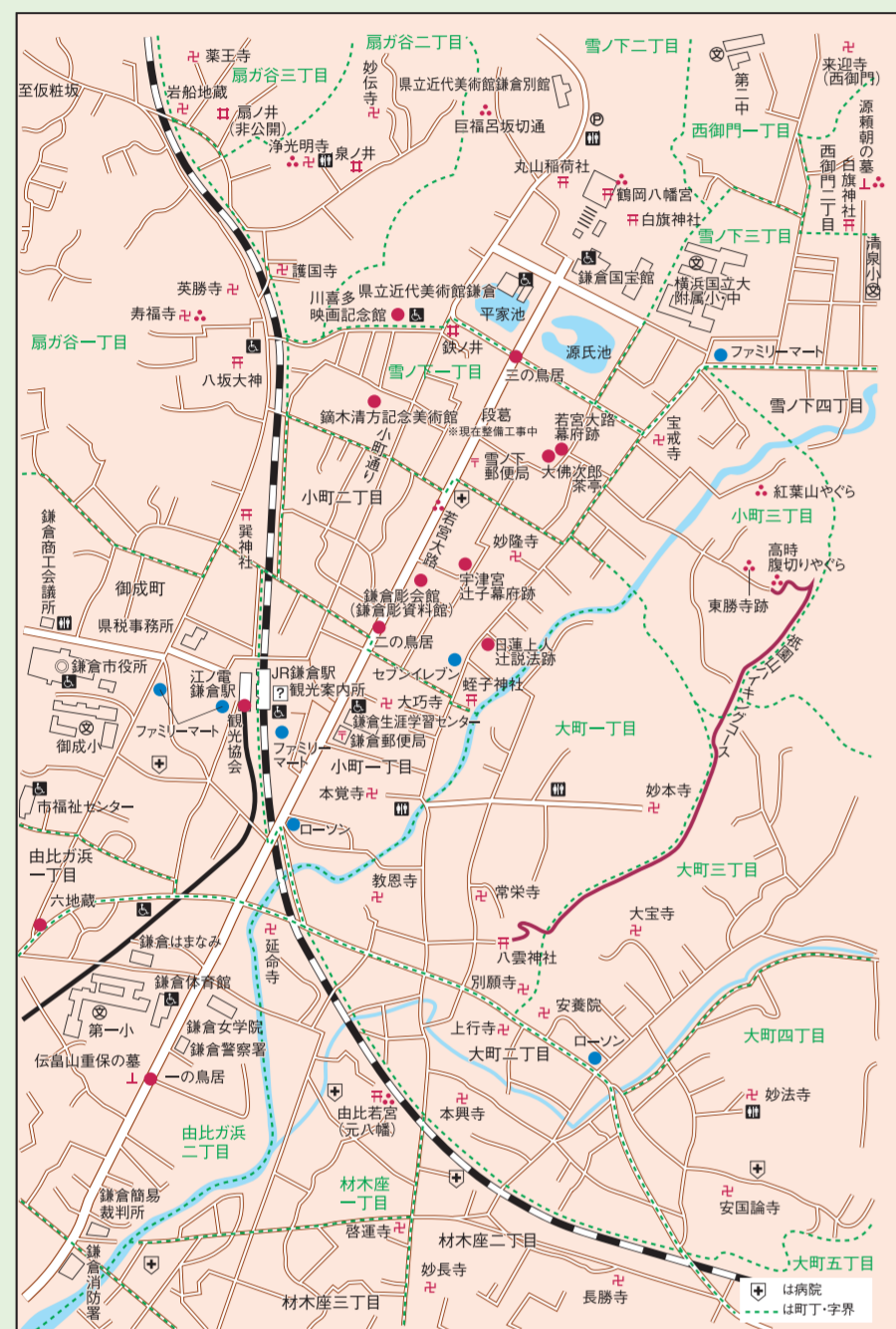
鎌倉駅付近拡大図